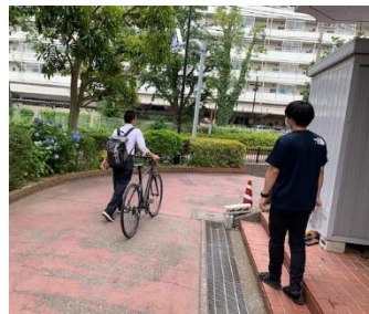
1年生の自転車登校も開始