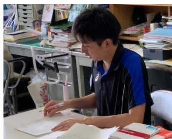
3年 ZOOMによる質問受付