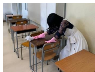
生徒下校後の消毒作業