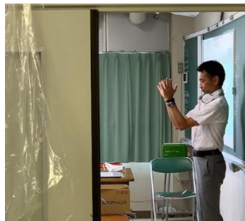
“Clap for Carers”3階フロアに拍手が響く