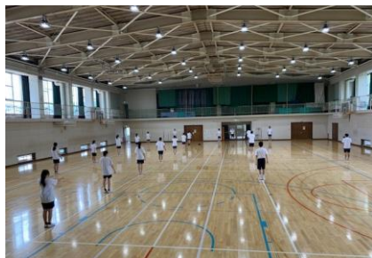
2年 三密を避けた体育の授業