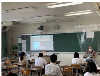
教室で学年主任の話を聞く2学年集会