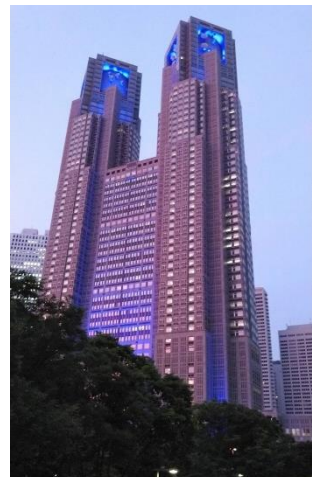
都庁ライトアップ 医療従事者への感謝